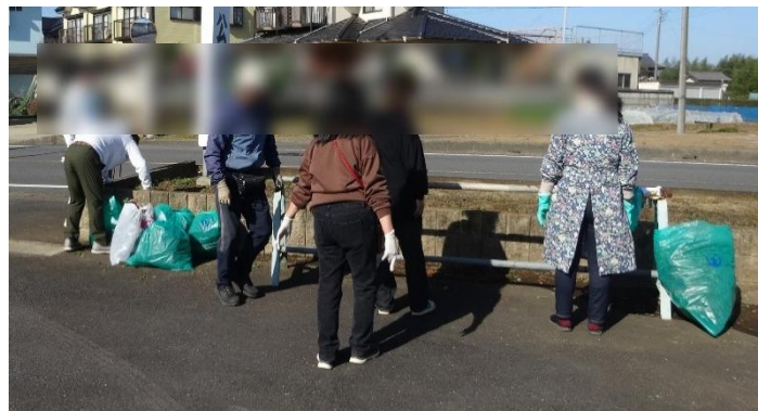
花壇の植え替え作業