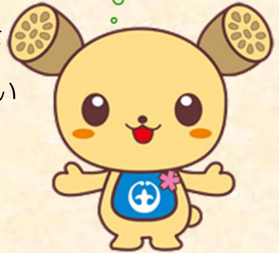
土浦市イメージキャラクター つちまる