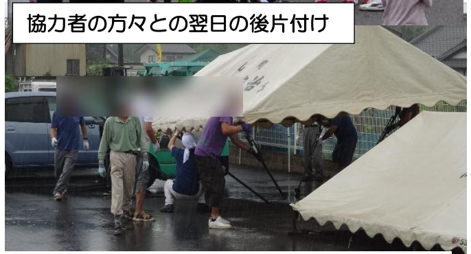
協力者の方々との翌日の後片付け