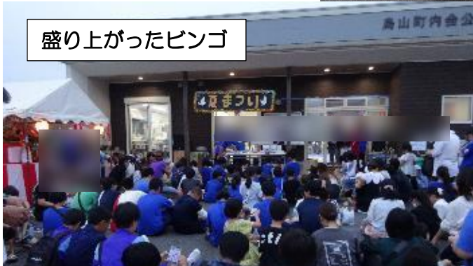
盛り上がったビンゴ