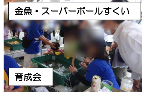
金魚・スーパーボールすくい