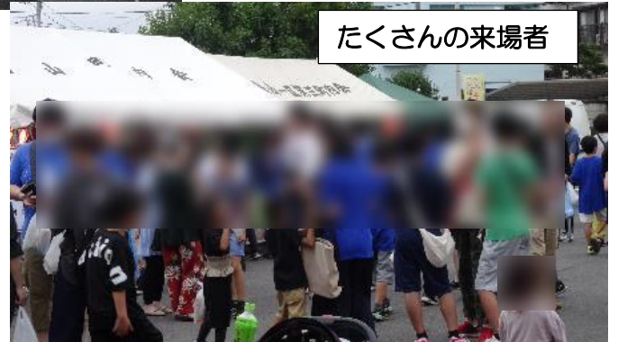
たくさんの来場者