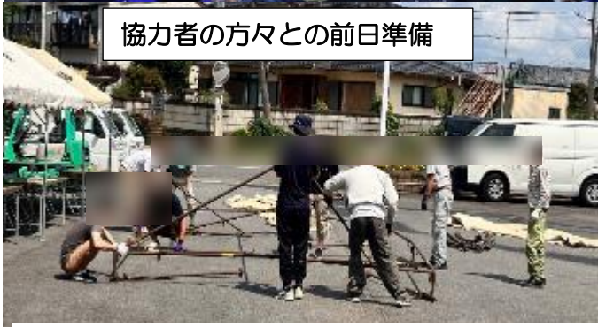
協力者の方々との前日準備