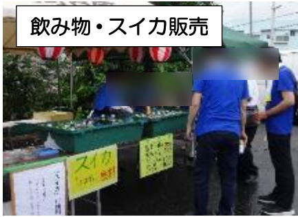
飲み物・スイカ販売