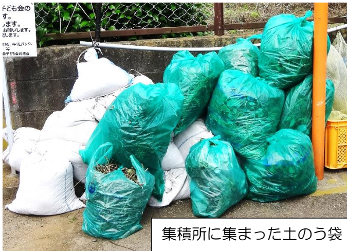
集積所に集まった土のう袋・ボランティア袋