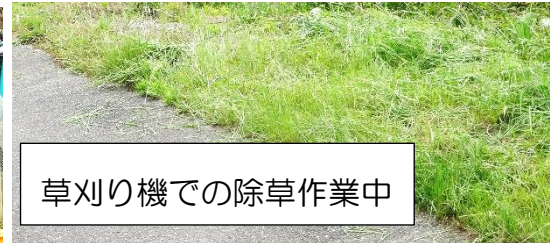
草刈り機での除草作業中