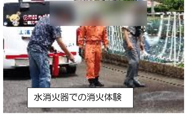
水消火器での消火体験