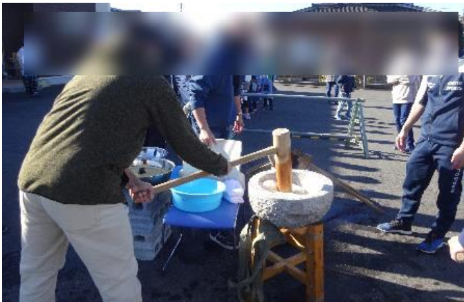
石臼と杵での餅つき体験

餅つき後は、育成会主催のクリスマス会があり、ビンゴなどで大いに盛り上がっていました。餅つきやあんころ餅づくりなどのお手伝いをしてくださった地域の皆様、ご協力ありがとうございました。