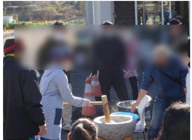
お汁粉・あんころ餅・きな粉餅作り