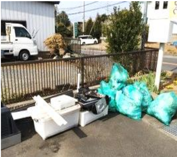
公民館に集めたゴミ (TVなどの不法投棄)