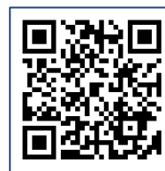
「My Betting」 QR コード